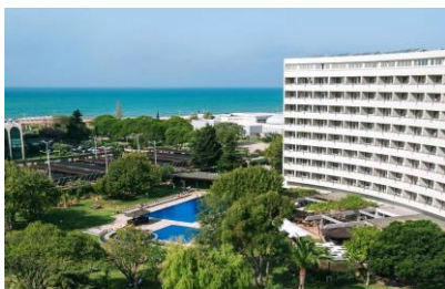
Dom Pedro Hotel Vilamoura

5 GOLFRUNDOR med spel på Vilamouras toppbanor – Mästerskapsbana Victoria (där Portugal Masters spelas som ingår i Europatouren), Old Course, Laguna, Millenium och Pinhal. Banorna är i absolut toppskick och vädret så här års är runt 20+. Det kommer även finnas olika tävlingar med priser att vinna.