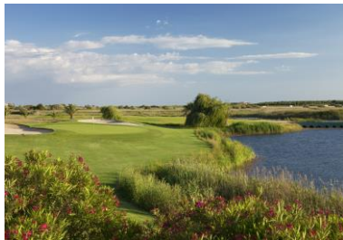
Laguna Golf Course

Kom och besök våra fantastiska golfbanor i "golfmekka" Vilamoura, med fem banor inom 10 minuters bilresa.