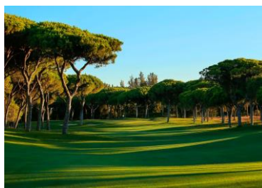
Millenium Golf Course